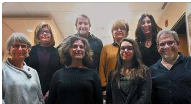
L'équipe d'animation de nos groupes de soutien pour proches aidants.

Communiquez avec un conseiller ou une conseillère de la Société Alzheimer de Montréal : 514 369-0800 | info@alzheimermontreal.ca