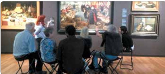
Visite guidée du Musée des beaux-arts de Montréal.