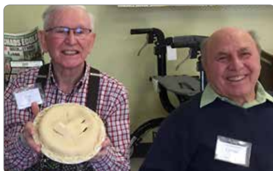
Activité de cuisine au centre d'activité Lachine.

UNE ÉVALUATION EST REQUISE AFIN DE RÉPONDRE ADÉQUATEMENT AUX BESOINS DE LA PERSONNE ATTEINTE.