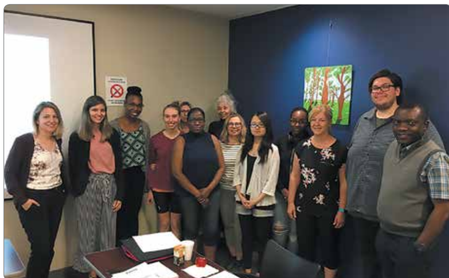
Participants à notre formation de base pour intervenants de la santé. Pour obtenir plus d'informations et vous inscrire, consultez la page 15.