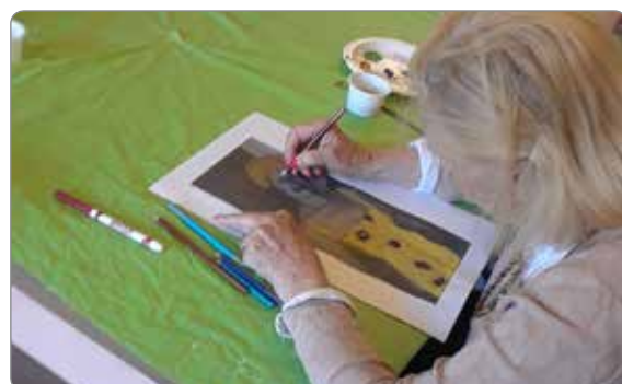
Activité artistique au centre d'activité Westmount.