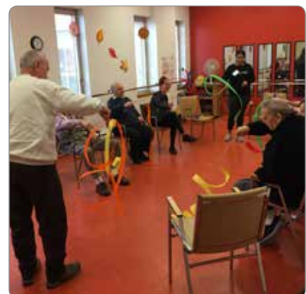
Activité physique au centre d'activité Lachine.