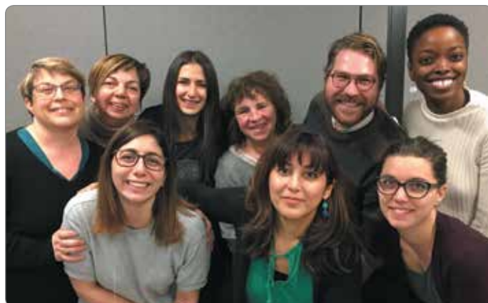
L'équipe de répit et de stimulation à domicile.