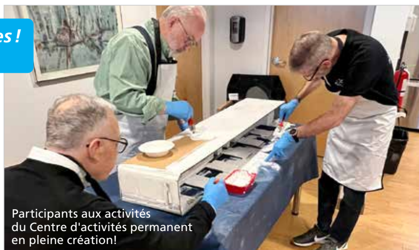
Participants aux activités du Centre d'activités permanent en pleine création!

Situé dans l'arrondissement Sud-Ouest de Montréal notre centre d'activités est sécuritaire, spacieux, chaleureux et entièrement conçu pour répondre aux besoins des personnes vivant avec un trouble neurocognitif et leur proche aidant. Les participants sont accompagnés par des intervenants qualifiés et formés leur permettant de mieux comprendre et communiquer avec les personnes atteintes.